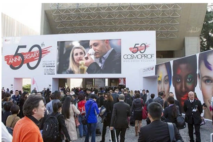
2017年 Cosmoprof 会場

第二次締切 2018年2月14日になります。(都合により、料金が上がる場合もございますのでご了承ください。)