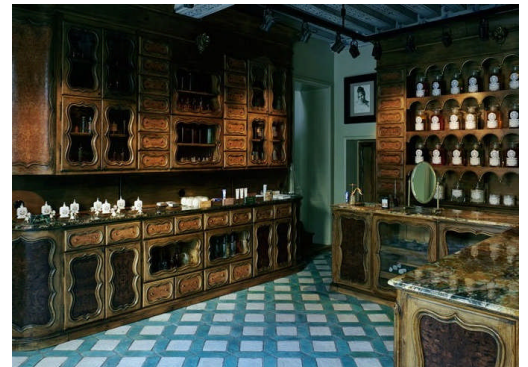
パリの Beauty Shop "BULY" (ビュリー)

その関連等、ヘアケア製品、パッケージ商品、原料関係。展示会はイタリアのボローニャで毎年開催され、過去50回の開催実績を誇っており、日本のコスメ業界の皆様には展示会の出展内容の評価が高く、ニュートレンドなBEUATY関連展示会であることご存知のことと思います。