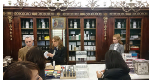
フィレンツェの薬店コスメ Annunziata(アヌンチアター)